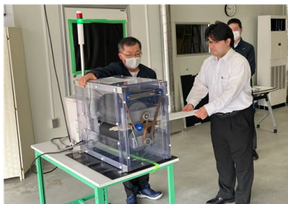
はさまれ・巻き込まれ体験