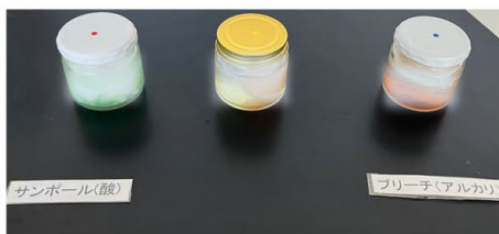
酸・アルカリ危険体感 詳細は現地でご覧ください