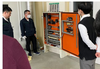
制御盤を使用した感電リスクの理解