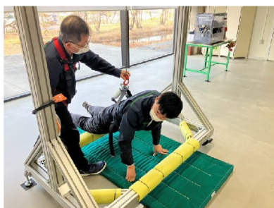
墜落制止器具のぶら下がり体感