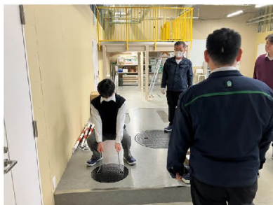
マンホールの開閉体感