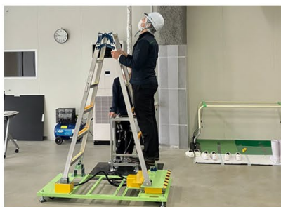
脚立のぐらつき体感