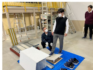
天井板の踏み抜き体感