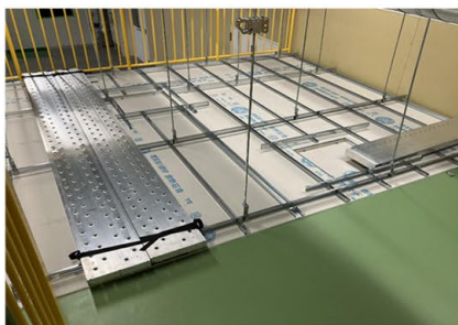
天井裏での安全作業体感