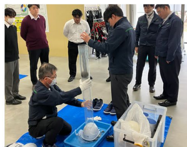
ヘルメットの強度体感